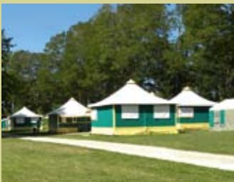
HÉBERGEMENTS EN BUNGALOWS (96 PLACES)