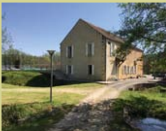
HÉBERGEMENTS EN DUR (42 PLACES)

Dans un cadre idéal au bord de la Dordogne